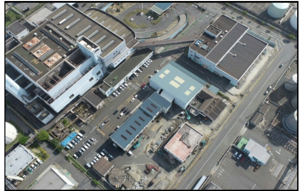
解体工事前の状況