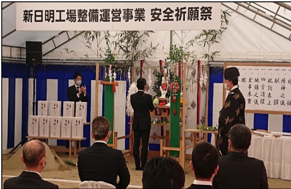
安全祈願祭実施の様子